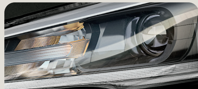
LED Projector Headlamps