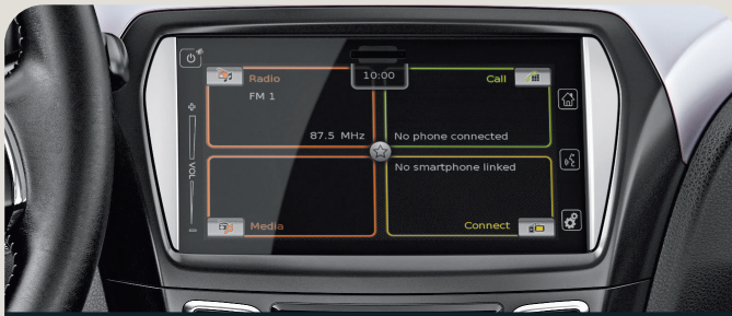
Smartphone Linkage Display Audio