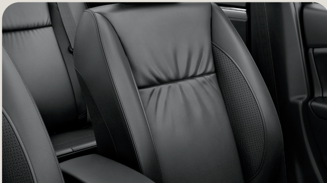
Sleek Leather Seats