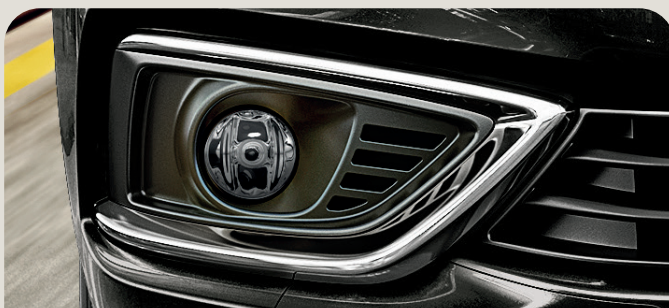
Fog Lamps with Chrome Accent